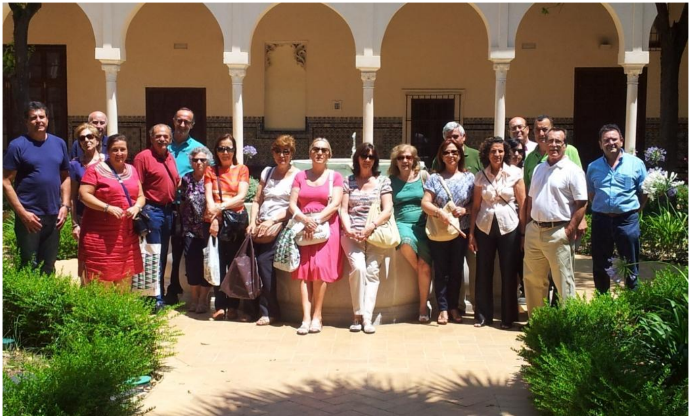
EL GRUPO QUE ASISTIÓ A LA SEGUNDA VISITA “LA SANTAS DE ZURBARAN”