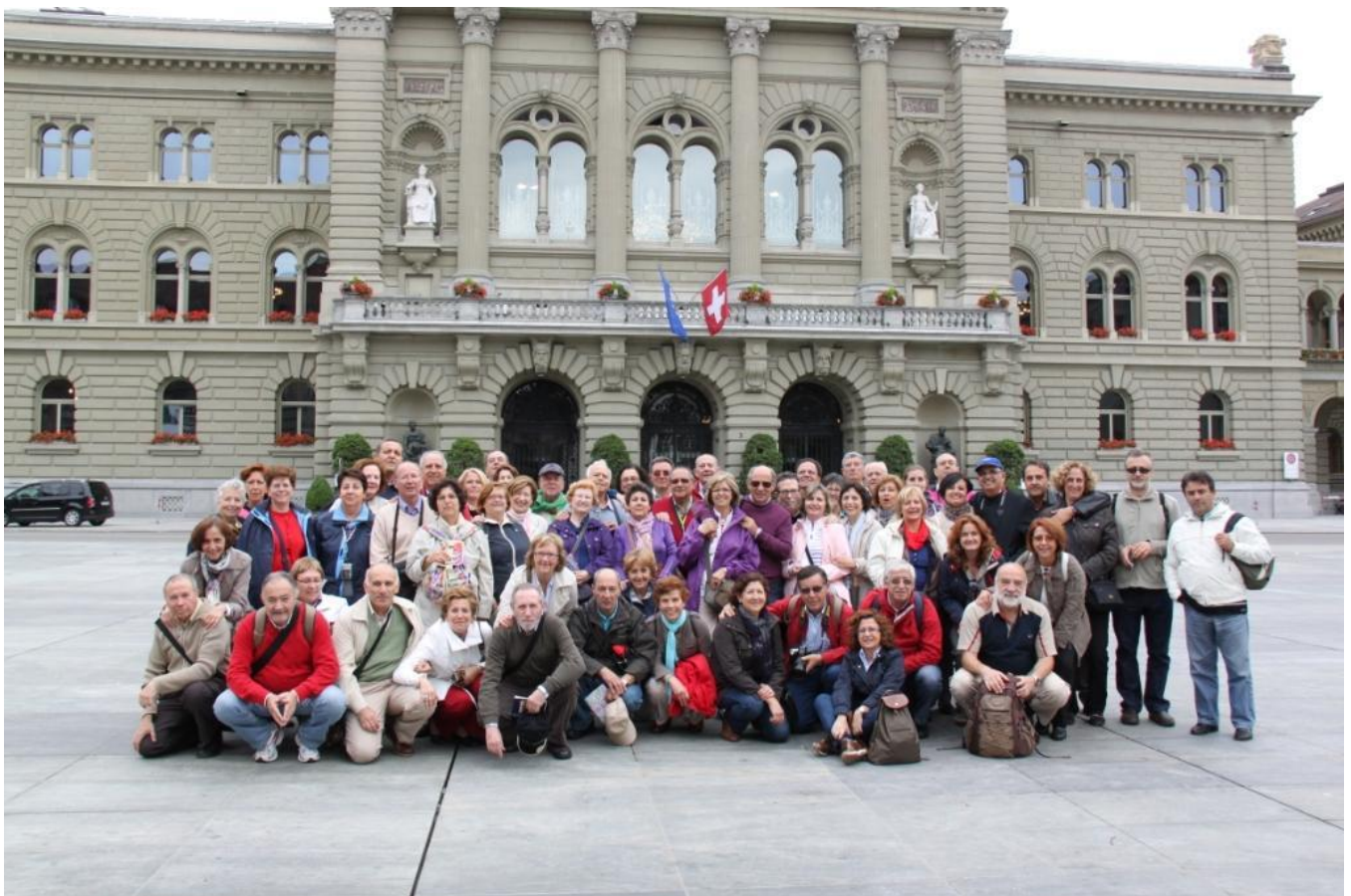
FIN DE CURSO 2011

Dejemos reposar a la nostalgia y reanudemos de nuevo el camino por el presente, ese camino que como dijo un poeta solo se hace al andar.