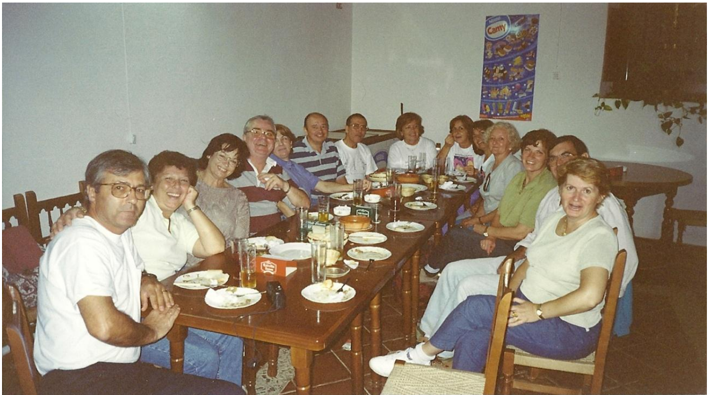
1998 ALGUNOS MIEMBROS DE LA PRIMERA JUNTA DIRECTIVA Y FAMILIARES